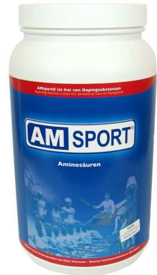
AMSPORT Aminosäuren von Mark Warnecke